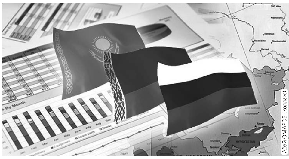
макроэкономикалық және валюта саясатында ортақ мәмілеге келу қажеттігі туындайды. Дегенмен ортақ валюта енгізу жайында әлі сөз жоқ.

Қазақстан, Ресей және Беларусьтің басын қосқан Бірыңғай экономикалық кеңістік (БЭК) 1 қаңтардан бастап күшіне енді. БЭК аумағында тауарлар, қызмет, капитал және еңбек күшінің еркін қозғалысын іске қосқан құжаттарға үш елдің мемлекет басшылары өткен жылдың желтоқсан айында қол қойғанын, интеграцияның ортақ бағыты БЭК-ке мүше елдердің өз экономикалық қызметін кеңістіктегі кез келген елдің аумағында бірдей құқықтық шарттармен жүргізуге мүмкіндік беретін бірқатар келісімдермен белгіленді.