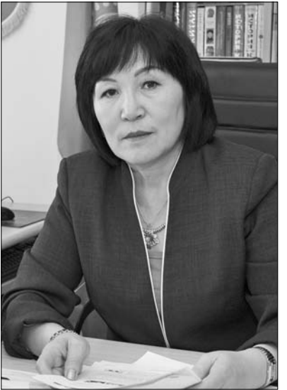
– Университеттегі инновациялар жайында айтып кетсеңіз?

– Әңгімеңізге рақмет! Сұхбаттасқан Болатбек МҰХТАРОВА